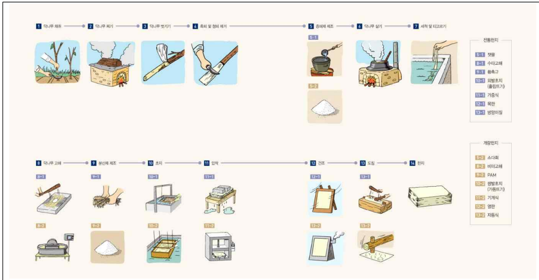
<전통한지와 개량한지의 주요 제작공정>