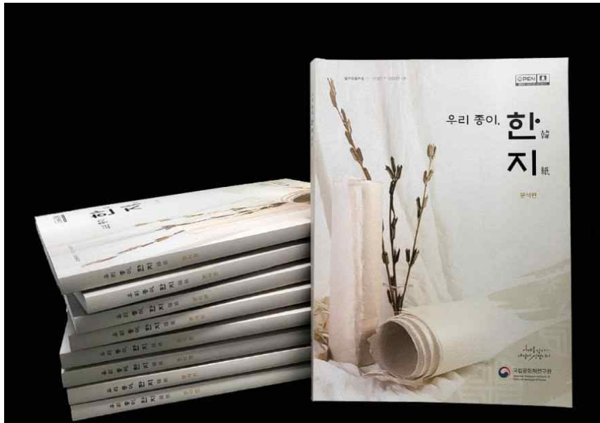
<우리 종이, 한지(韓紙) -분석편- 보고서> 발간