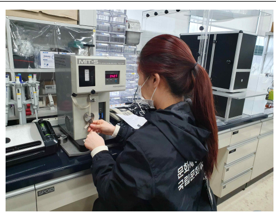
<한지 품질 평가를 위한 과학적 분석 내절강도 측정>