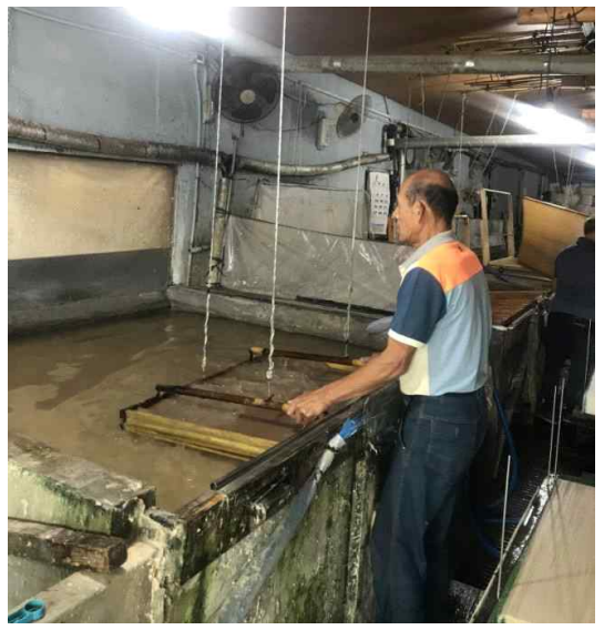
<한지 제작과정 흘림뜨기(좌), 가둠뜨기(우)>