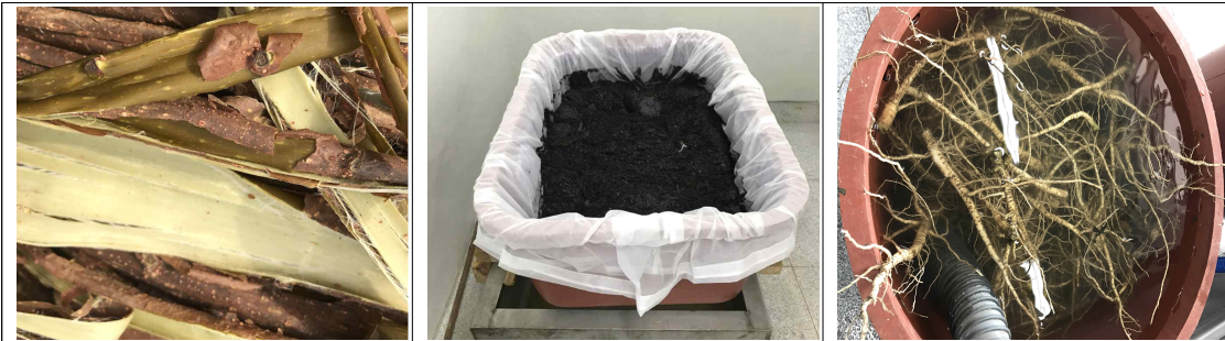
<한지 제작에 사용되는 주원료 닥나무 껍질(좌), 천연재(중), 황촉규 뿌리(우)>