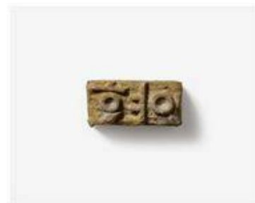
<1465년 『원각경(圓覺經)』(호림박물관)과 을유자 ‘幻’ >