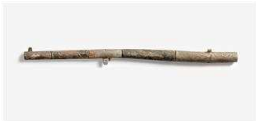
<승자총통(勝字銃筒), 소승자총통(小勝字銃筒)>