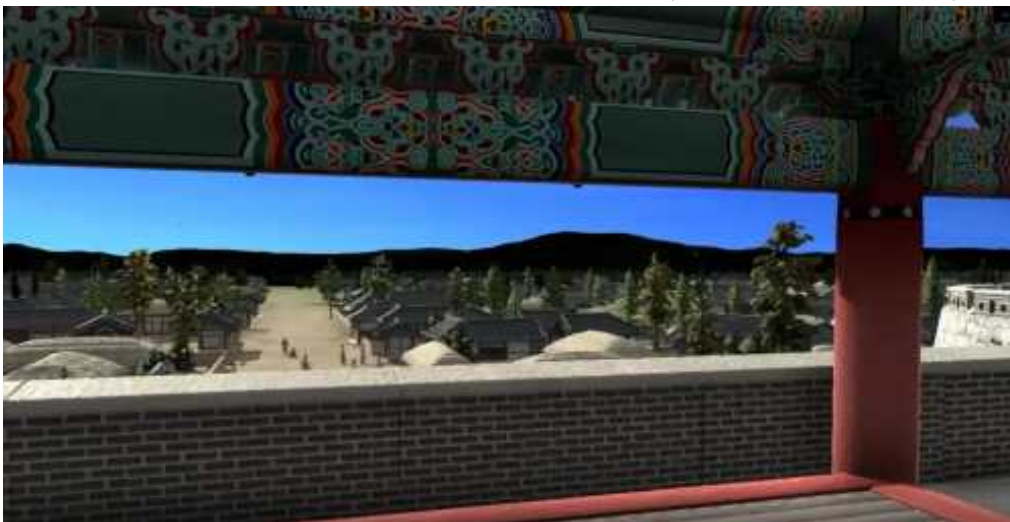
<돈의문 가상현실 체험관 실행 이미지 (돈의문 문루 안 한양 풍경)>