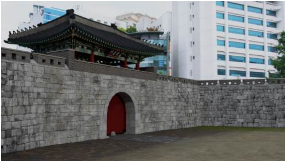
<돈의문 증강현실 모바일 실행 이미지(강북삼성병원 부근 촬영)>