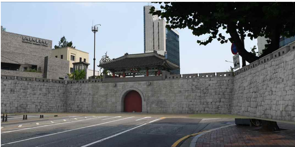
<돈의문 증강현실 모바일 실행 이미지(정동사거리 남서방향 촬영)>