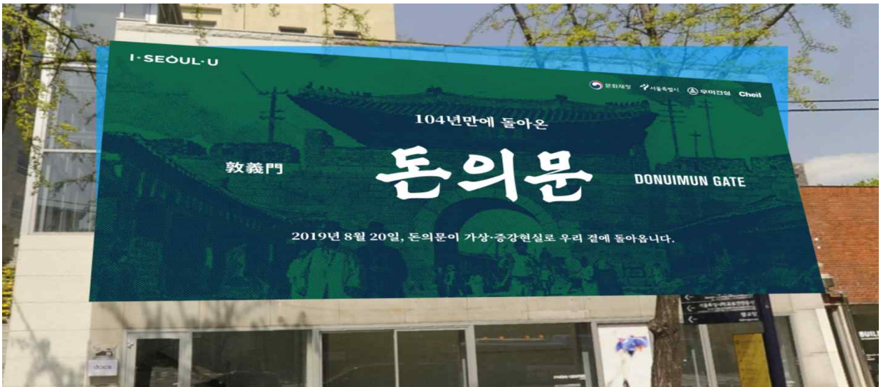
<돈의문 디지털 복원·활용 홍보용 걸개 이미지(돈의문 체험관 2~3층)>