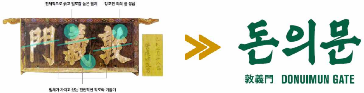
<돈의문 현판(고궁박물관 소장)의 글자체를 활용한 돈의문 로고 개발>