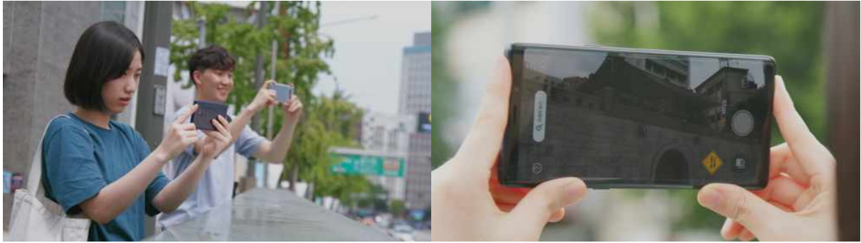
<돈의문 증강현실 모바일 애플리케이션 실행 사례>