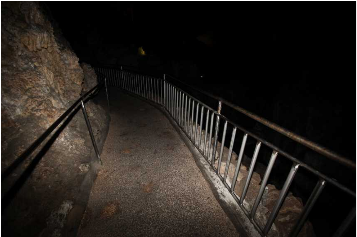
<해외사례: 미국 뉴멕시코주에 있는 칼스배드동굴(Carlsbad Cavern)의 비포장도로>