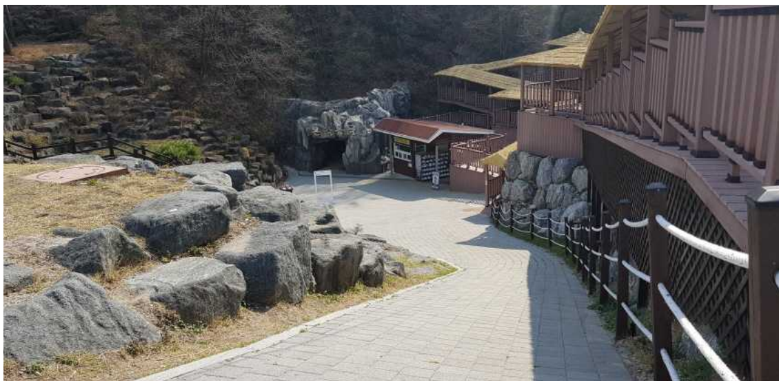
<단양 온달동굴 입구>